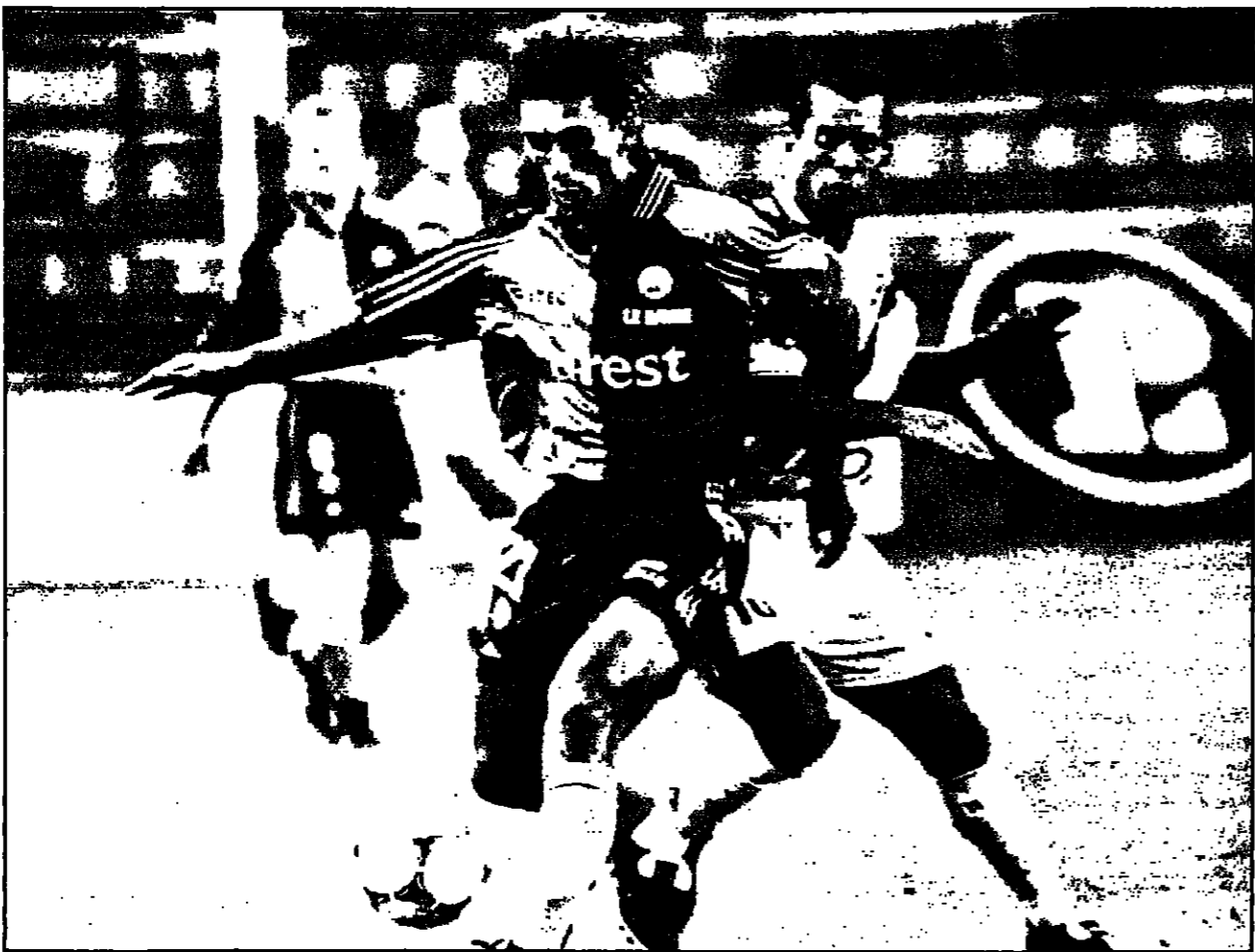
لقطة من مباريات التأهل لبطولة العالم لكرة القدم النسائية تظهر فيها التونسية مارغون موزيت (يمين) تصارع موزين مارلي في المباراة التي فلات فيها للتونج 2/0